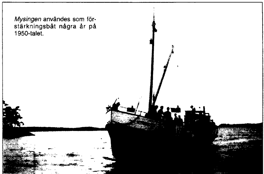
Mysingen användes som förstärkningsbåt några år på 1950-talet.